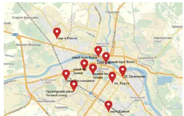
Рис. 1. Отборы осадков в городе Твери

В нашем исследовании были взяты точечные пробы атмосферных осадков в различных районах города и за его пределами (рис. 1, 2).