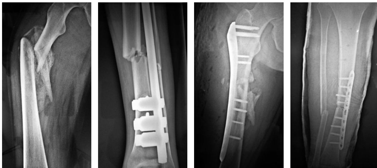
Рис. 3. Рентгенограммы пациента Г. с переломом бедренной и большеберцовой костей до операции и после остеосинтеза переломов

В послеоперационном периоде проводилась инфузионная, заместительная трансфузионная и антибактериальная терапия. После заживления ран пациент выписан по месту жительства с рекомендацией последующей реабилитации.